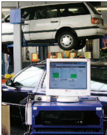
Von der Auftragsannahme über die Prüfstraße bis hin zum Abgastester: Beim Jülicher Bosch-Service Franken sind die unterschiedlichsten Arbeitsplätze und Geräte miteinander vernetzt.